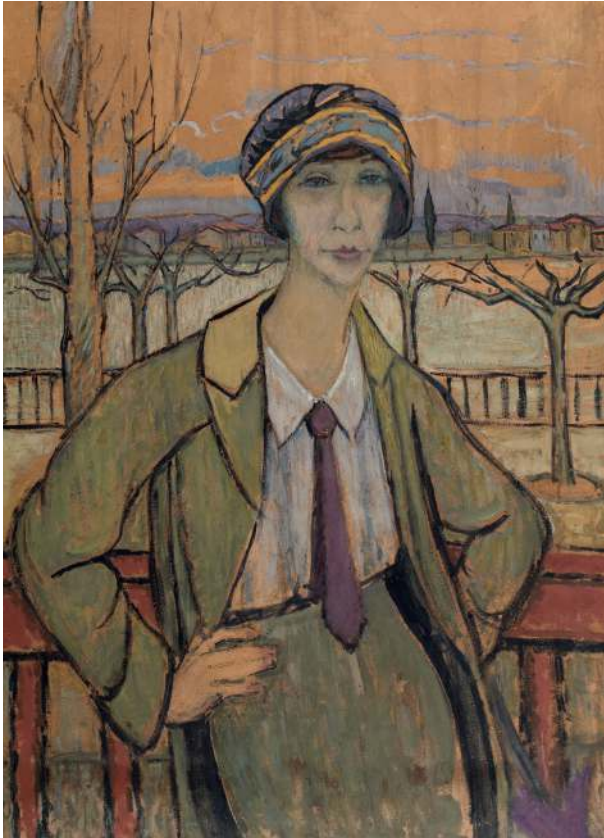
Portrait de l'artiste à Serrières, vers 1920 Huile sur carton, 106 x 78 cm Paris, Fondation Albert Gleizes ADAGP, Paris 2021