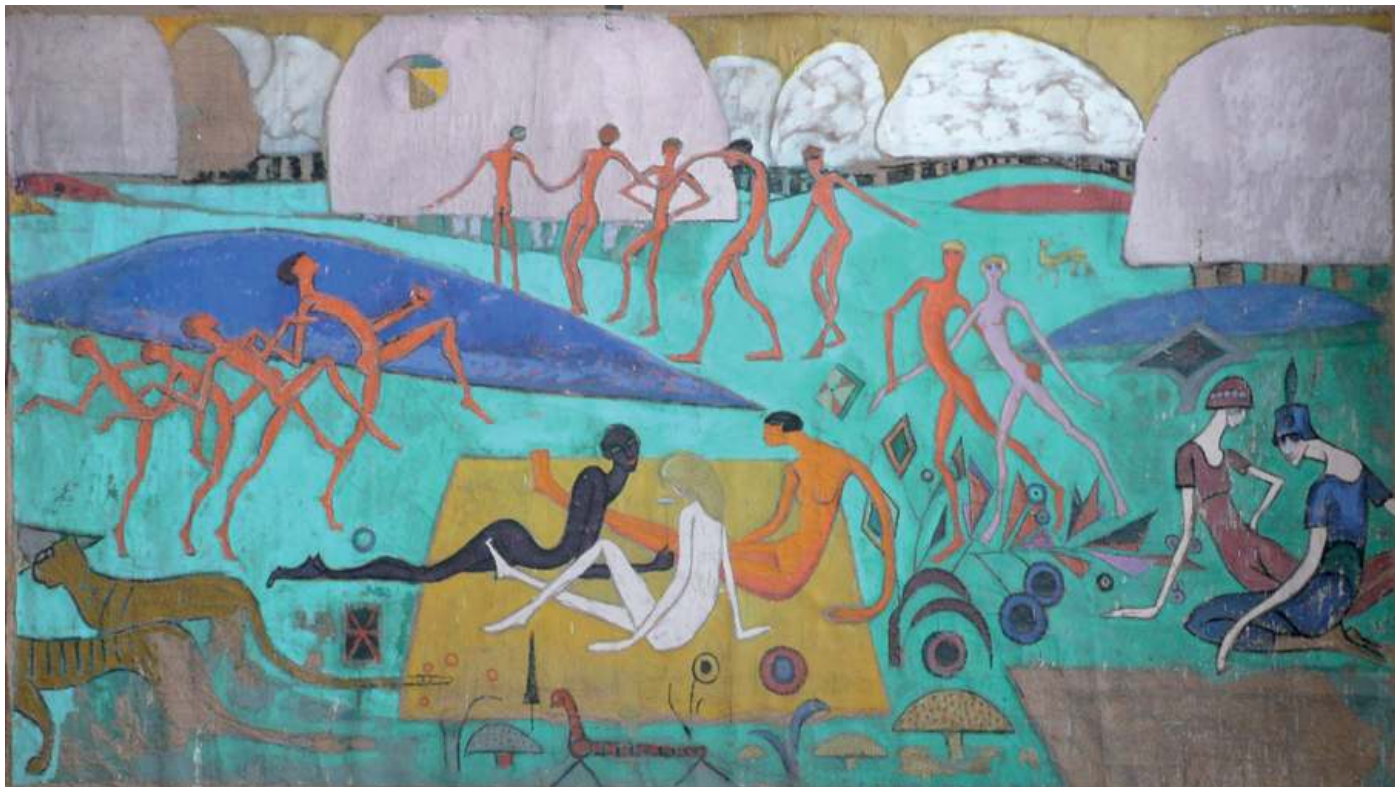
American picnic , 1917 Huile sur toile, 217 x 374,5 cm (avant restauration) Paris, Fondation Albert Gleizes ADAGP, Paris 2021

Conçue en partenariat avec la Fondation Albert Gleizes par le musée des beaux-arts et d'archéologie de Besançon, le MASC, Musée d'Art Moderne et Contemporain des Sables d'Olonne et le Musée Estrine de Saint-Rémy-de-Provence, l'exposition sera présentée dans ces deux dernières institutions en 2022.