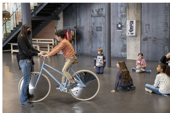
Les ateliers 7-12 ans