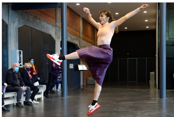
Gerard & Kelly, Clockwork , 2018, collection Frac Franche-Comté, © Gerard & Kelly. Photo : Blaise Adilon

Cycle de conférences conçu et réalisé par Connaissance de l'Art Contemporain Tarif plein : 6€, tarif réduit : 4€ (amis du Frac, publics en situation de handicap et demandeurs d'emploi) / gratuit pour les étudiants