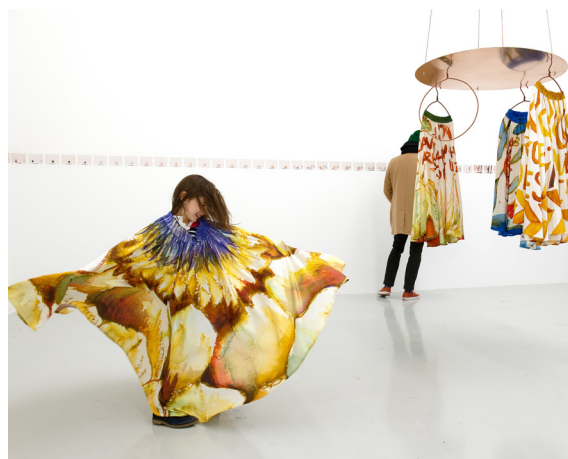
Alex Cecchetti, Dervish Skirts (Jupes derviches) , 2020, Collection Frac Franche-Comté © Alex Cecchetti. Exposition Aller contre le vent, performances, actions et autres rituels , commissariat Sylvie Zavatta.

L'exposition propose une traversée de la collection du Frac Franche-Comté en rassemblant des œuvres qui, de par leur dimension performative, engagent le vivant. Parmi elles, les œuvres immatérielles que sont les performances proprement dites, activées par leur créateur ou, selon le protocole qu'il aura défini, par son « suppléant » ; des œuvres qui documentent et archivent des performances non « réactivables » celles-là ; d'autres bien matérielles, qui ne trouvent leur plénitude et leur sens que par l'intervention physique d'un public devenu acteur ; et des œuvres enfin qui empruntent au spectacle vivant.