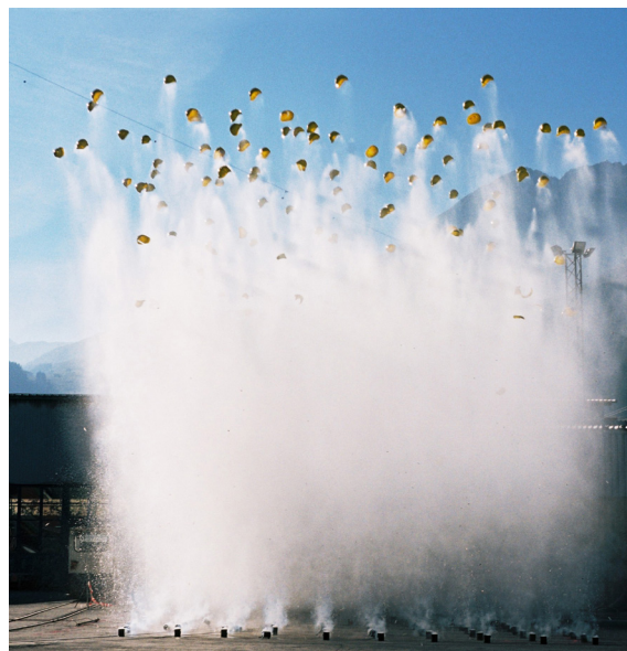
Roman Signer, Salut , 2010, collection Frac Franche-Comté © Roman Signer.

Cycle de conférences conçu et réalisé par Connaissance de l'Art Contemporain Tarif plein : 6€, tarif réduit : 4€ (amis du Frac, publics en situation de handicap et demandeurs d'emploi / gratuit pour les étudiants