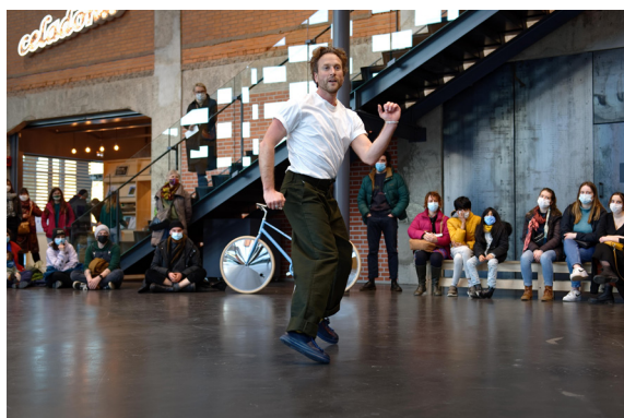
Gerard & Kelly, Clockwork , 2018, collection Frac Franche-Comté, © Gerard & Kelly. Photo : Blaise Adilon

Cycle de conférences conçu et réalisé par Connaissance de l'Art Contemporain Tarif plein : 6€, tarif réduit : 4€ (amis du Frac, publics en situation de handicap et demandeurs d'emploi) / gratuit pour les étudiants