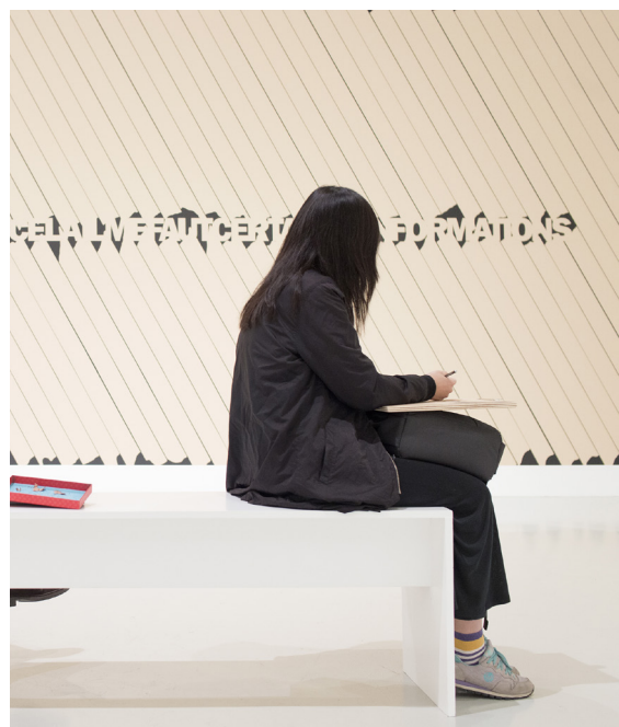
Visite de l'exposition Sylvie Fanchon, Je m'appelle Cortana