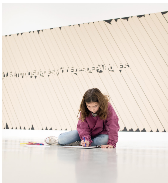
Visite de l'exposition Sylvie Fanchon, Je m'appelle Cortana