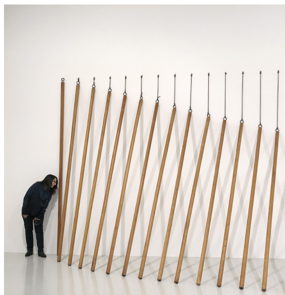
L'expérience du sensible en méditation