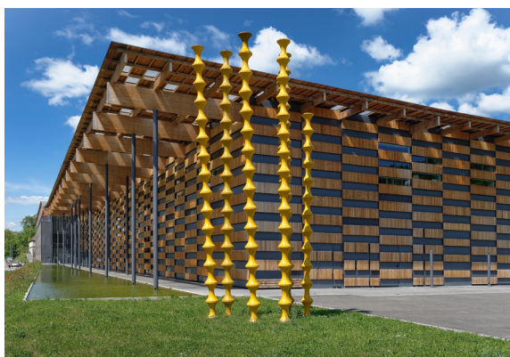
Frac Franche-Comté, Cité des Arts, Besançon, Kengo Kuma & Associates / Archidev.

Le Frac est accessible aux personnes en situation de handicap. À chaque exposition, une visite en langue des signes est programmée. Fiches en braille, guides « facile à lire et à comprendre », guides en gros caractères, boucles auditives, cannes siège et un fauteuil roulant sont disponibles sur place.