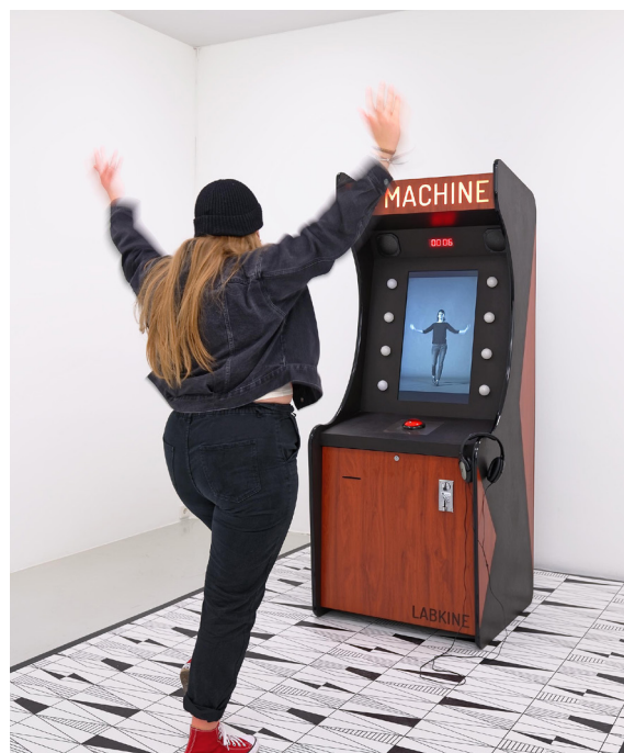
Compagnie Labkine, LA MACHINE, 2020-2021, collection Frac Franche-Comté