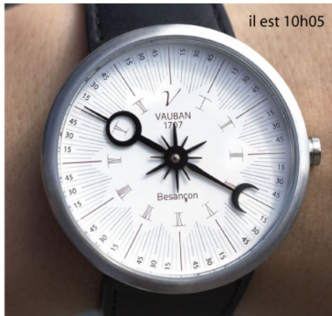
Modèle Blanc / bracelet noir

Boitier Inox, verre minéral bombé, étanche 3 atm, garantie 2 ans