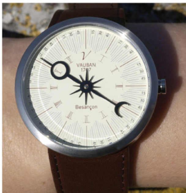
Modèle Ivoire / bracelet Brun